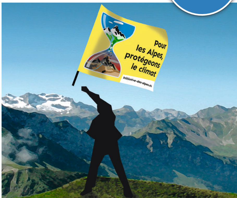
Illustration : Esther Probst

Vous trouvez les activités de l'Initiative des Alpes et la possibilité de commander notre drapeau à la page 8. Et bien sûr d'autres infos sur notre site de campagne !